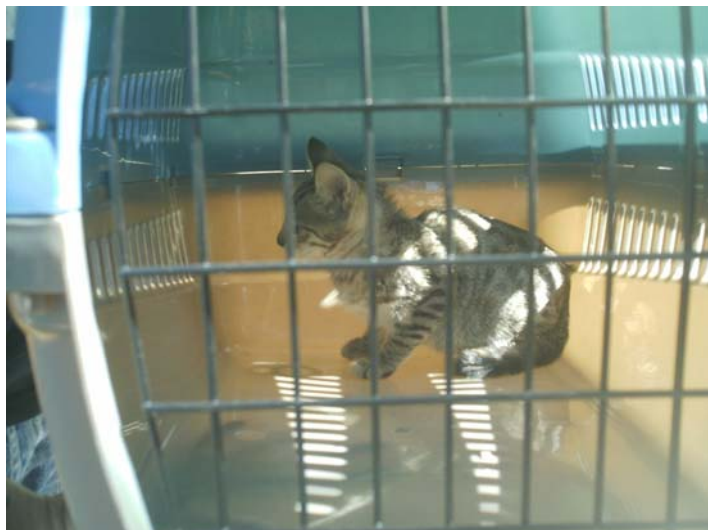
Y aquí recién capturado, camino de su nuevo hogar con sus papis