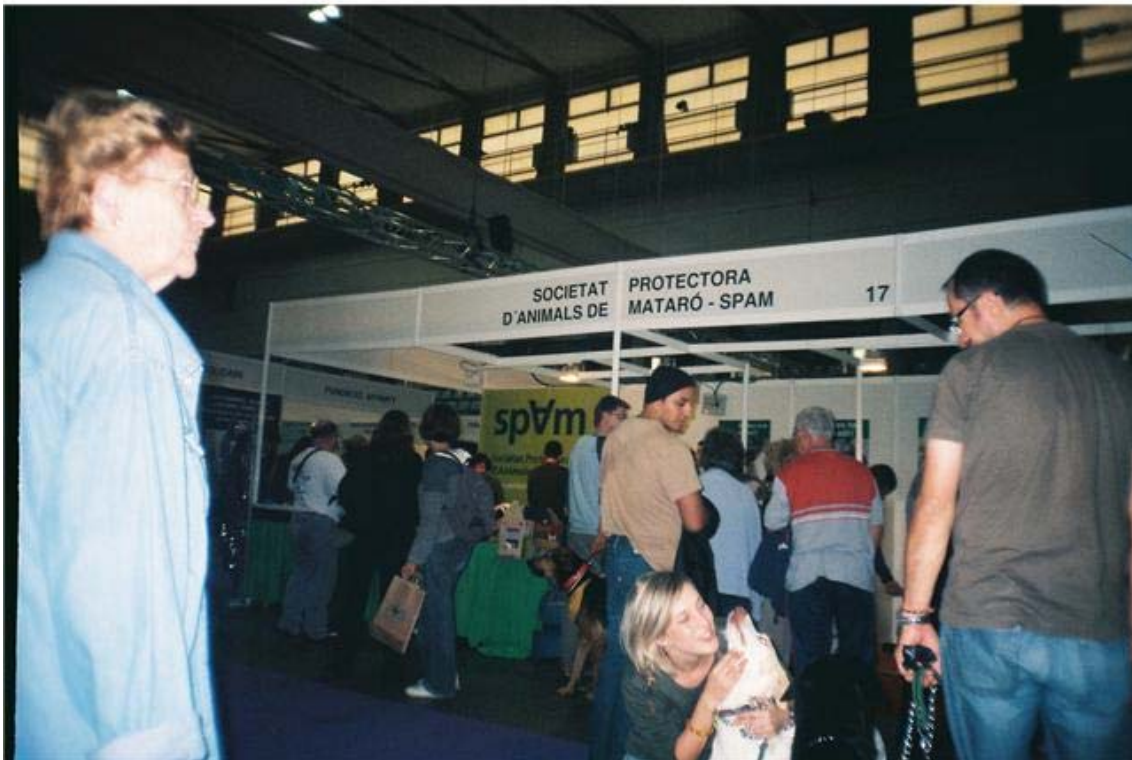
Stand de la Societat Protectora D'Animals de Mataró

Este boletín lo hacemos entre todos. Si quieres colaborar envíanos lo que quieras publicar a sos-abandonados@hotmail.es