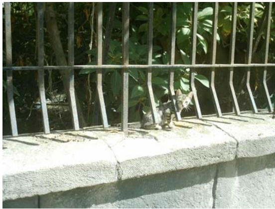
El peque minutos antes de ser adoptado

Menuda suerte has tenido tigrillo porque hasta en encontrarte un hogar te has adelantado a tu hermano. Mucha suerte minino!!