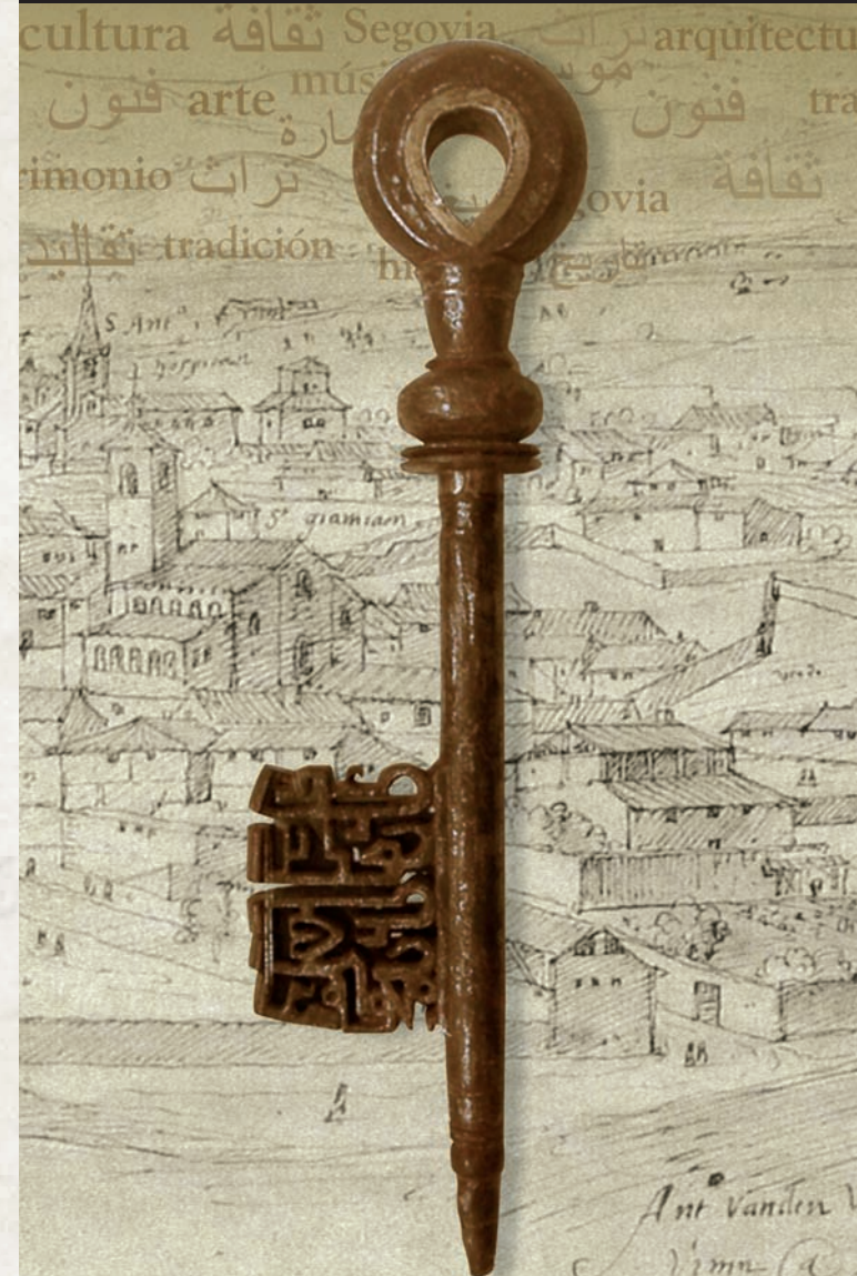
Llave islámica. Siglo XIV. Museo de Segovia